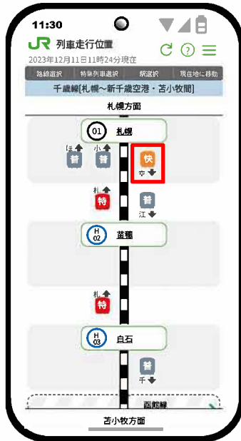
【列車走行位置のイメージ】